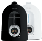
Увлажнитель воздуха RHF-3301