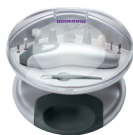
Маникюрный набор RNC-4901